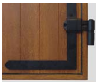
Cerniera a squadra o bandella